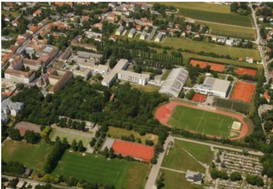
De la Salle Schule (Ansicht von oben)